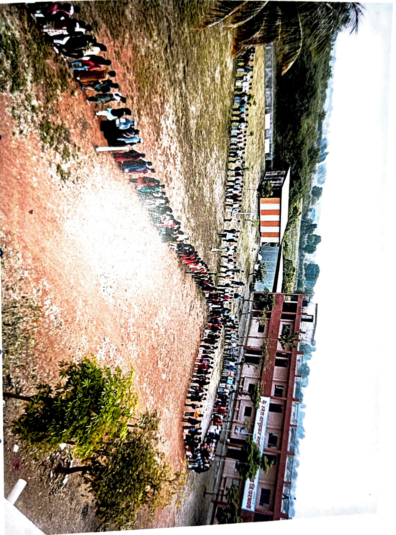
ಶಿಕ್ಷಣ ಇಲಾಖೆ ಮತ್ತು ಸರ್ಕಾರಿ ಶಾಲೆಗಳಲ್ಲಿ ಶಿಕ್ಷಣ.